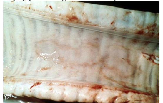
牛氣管黏膜呈現斑狀充血

http://www.cfsph.iastate.edu/DiseaseInfo/disease-images.php?name=lumpy-skin-disease&lang=en