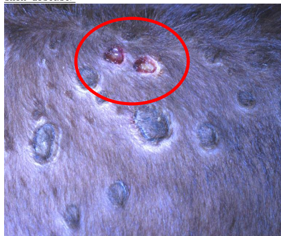
痂皮脫落後呈現坐鞍瘤 (seatfasts)

https://www.nadis.org.uk/disease-a-z/cattle/lumpy-skin-disease/