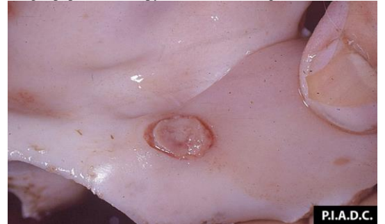
牛鼻甲黏膜結節之糜爛病變

http://www.cfsph.iastate.edu/DiseaseInfo/disease-images.php?name=lumpy-skin-disease&lang=en