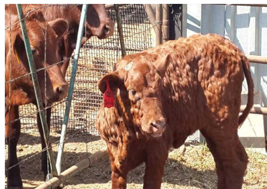
牛隻感染牛結節疹皮膚明顯的結節或硬塊

https://www.pirbright.ac.uk/news/2017/07/news-feature-emergence-lumpy-skin-disease-europe