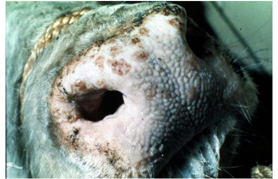
鼻鏡上可見多處輕微凸起的丘疹，表層通常伴隨糜爛並延伸入鼻孔

http://www.cfsph.iastate.edu/DiseaseInfo/disease-images.php?name=lumpy-skin-disease&lang=en