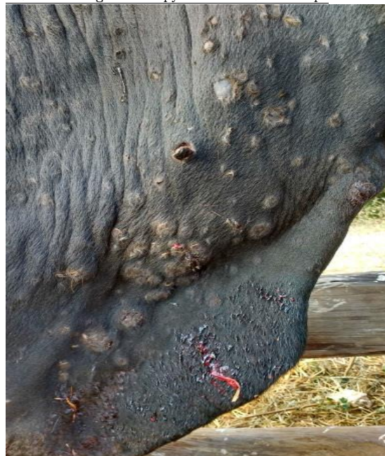
牛隻感染牛結節疹皮膚典型的結節 (John Atkinson 拍攝)

https://www.pirbright.ac.uk/news/2017/07/news-feature-emergence-lumpy-skin-disease-europe