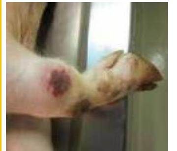
圖：關節腫脹伴隨皮膚壞死