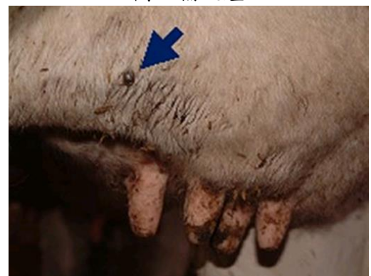
圖：正在吸血的壁蝨