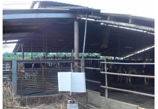
圖：黏蟲板放置地點