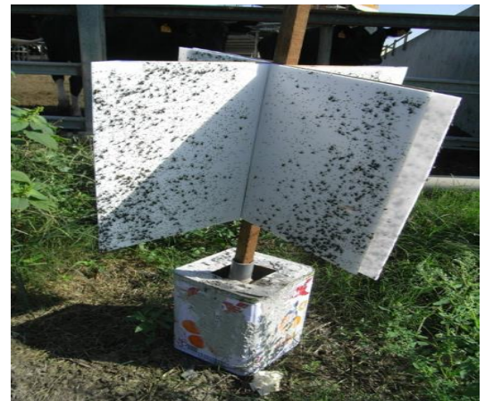
圖：黏蟲板：每個方位具兩個 30*45 公分之平面，以谷線對準各方位。陷阱最高點離地 1 公尺，底部利用水泥桶固定