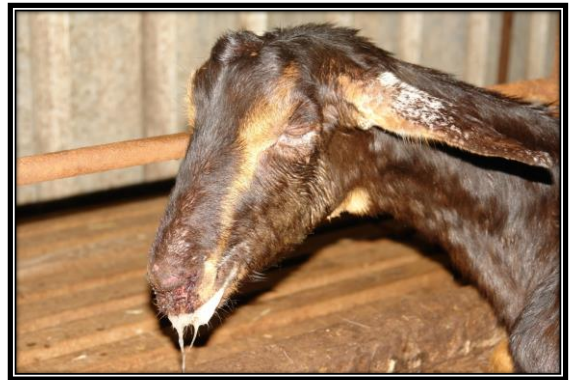
圖：口、唇、臉部周圍小紅疹、丘疹、圓型潰瘍及結痂等病變