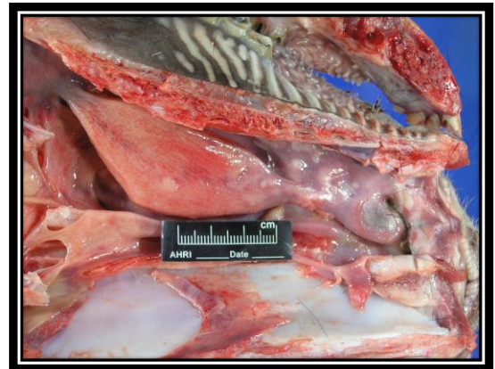
圖：口腔、嘴唇及舌等黏膜組織大小不一丘疹及小水泡，口、唇嚴重潰瘍灶