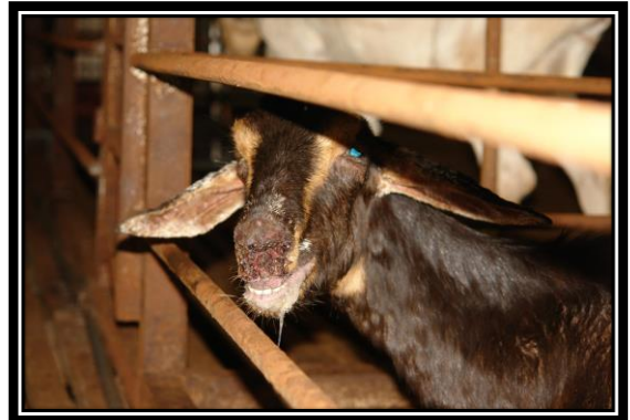
圖：口、唇、臉部周圍小紅疹、丘疹、圓型潰瘍及結痂等病變