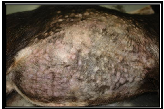
圖：皮膚出現突起之硬實結節