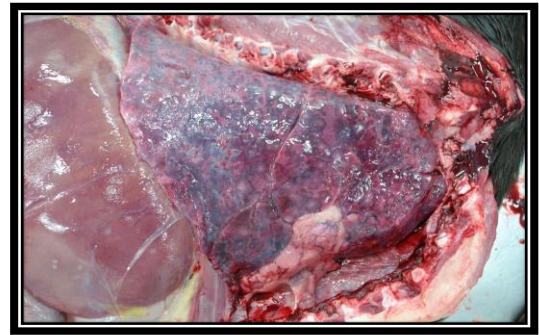
圖：纖維素性胸膜肺炎肺濕重潮紅