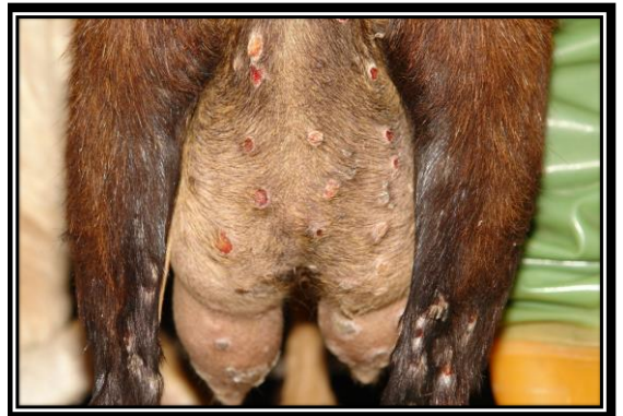
圖：乳房皮膚組織小紅疹、丘疹、圓型潰瘍及結痂等病變